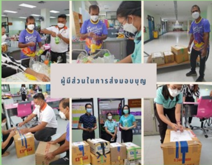
ผู้ส่วนในการส่งมอบบุญ